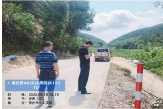
图 18 德庆县实时记录农村公路情况

“路长制”的实施为党员干部和群众参与农村公路治理提供了新途径，全市共张贴、悬挂宣传标语 759 幅，营造了“全民动员、全民参与”的工作氛围，涌现出不少党群联动爱路护路的先进典型。