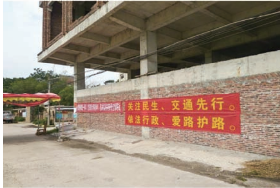
图 21 鼎湖区加强爱路护路宣传