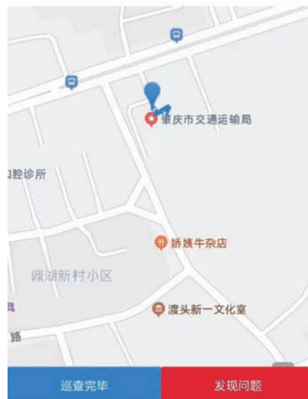
图 14 巡查轨迹