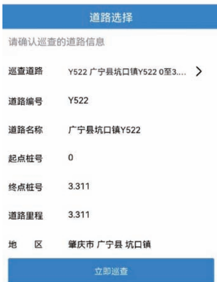
图 13 巡查界面

路长及相应的巡查工作组成员按要求定期使用 APP 上路巡查，巡查时提前打开手机位置信息定位功能（GPS 或北斗），并保持 APP 处于开启状态，巡查过程中 APP 将自动记录巡查轨迹，巡查结束时 APP 将自动生成巡查记录，并可在“巡查情况”界面查看巡查轨迹。