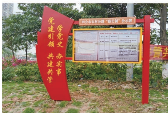
图6 地方特色公示牌

为做好路长信息公示，加强社会公众参与，肇庆市在公路显著位置（路线起、终点，农村公路公交站点、交叉路口等）竖立路长公示牌，公示路长及责任路段、工作职责、监督电话等信息，广泛接受社会监督，督促路长履职尽责。近期还开发了“扫码问路”功能，通过增设二维码，提供群众互动渠道，目前已在端州区率先全面应用（图7）。