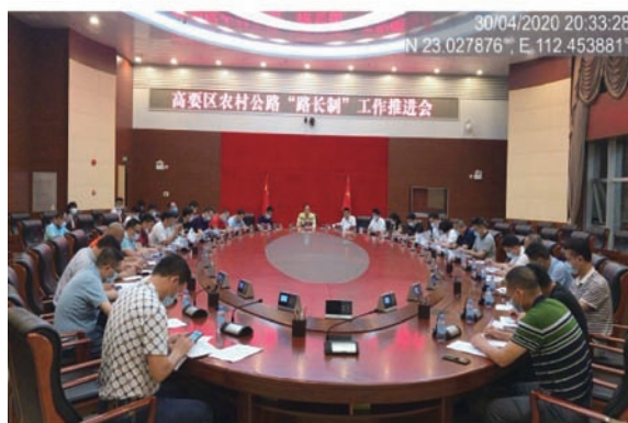
图 16 高要区“路长制”会议

我市通过建立覆盖县、乡、村道的“路长制”体系，按照“县道县管、乡村道乡村管”的原则有效落实了主体责任，提高了各级政府对农村公路管理养护的重视程度。当前，全市农村公路管理机构设置率、农村公路列养率、农村公路爱路护路、村规民约制定率均已达到 100%。2020 年，通过建设攻坚，实现了“砂土路清零”“县通镇三级路”“100 人以上自然村通硬化路”“村村通客车”等目标。2021 年，我市在全省“四好农村路”高质量建设发展工作视频会议上进行工作经验交流。同时，辖区四会市已成功创建全国“四好农村路”示范县，广宁县已入选省级“四好农村路”示范县推荐名单。