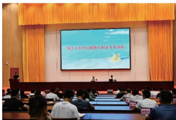
图 9 市委党校路长业务培训