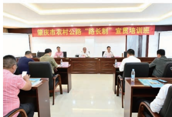
图 10 市路长办培训工作会议