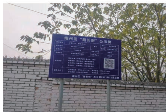
图7 端州区二维码应用情况