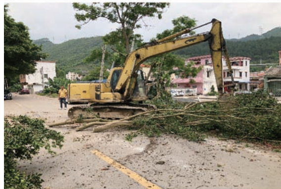
图 20 端州区路长报告处置倒伏大树