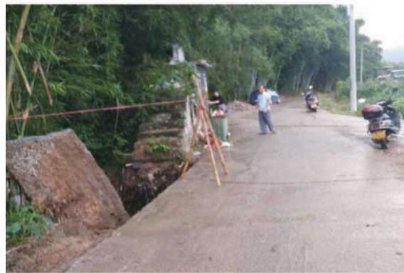
图 19 封开县乡道路长警戒安全隐患