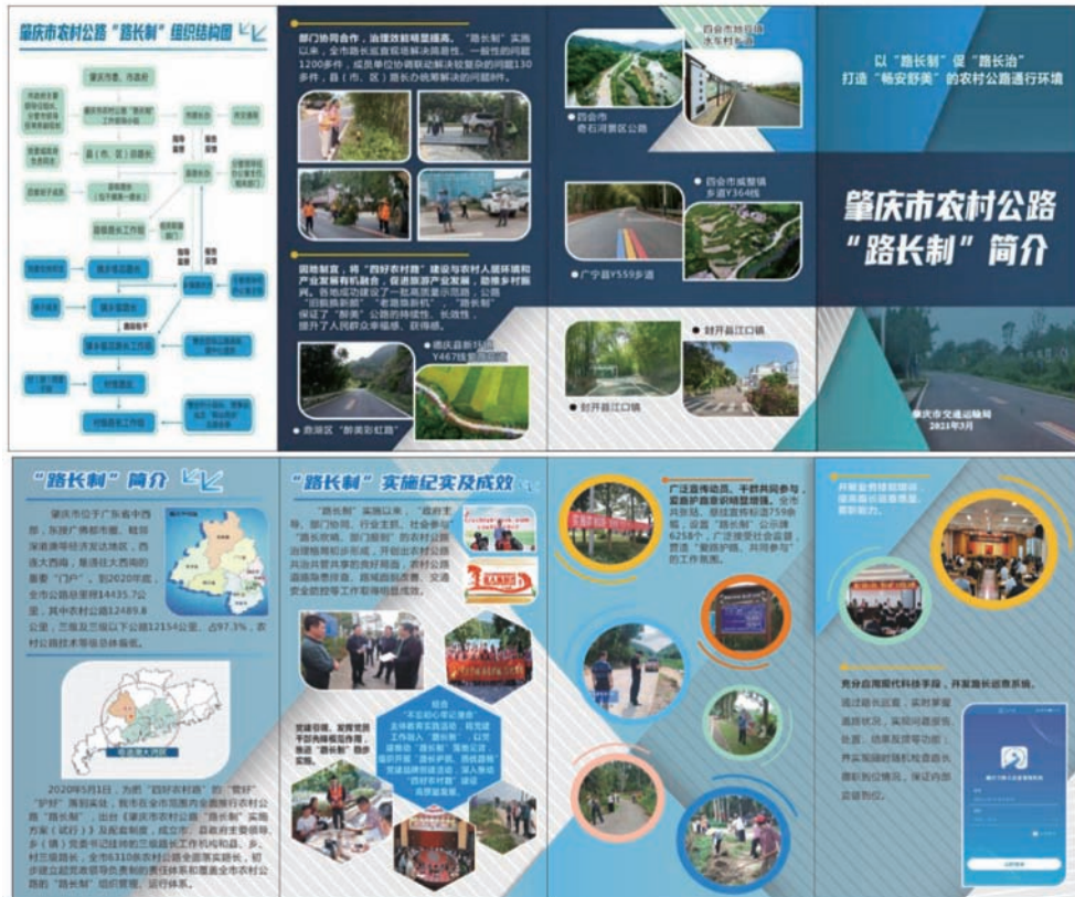
图 8 宣传手册