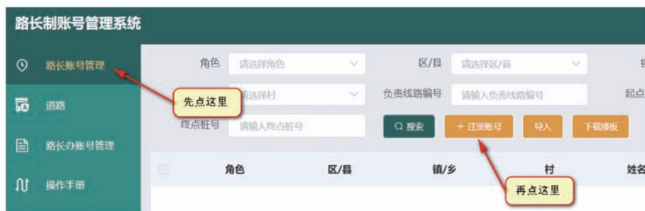
图 15 图形化工作指引

为便于基层理解、执行，市路长办组织编制了一系列详细周密的图文指引，包括《“路长制”机构及路长设置指引》《路长巡查管理系统账号注册及 APP 操作指引》《公示牌设置指引》等。