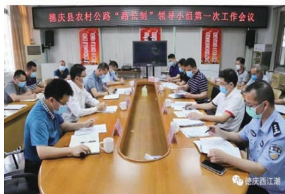
图 17 德庆县“路长制”会议